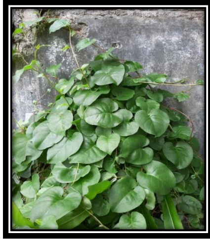
Gambar 2 Anredera cordifolia (Dokumen pribadi,2022)