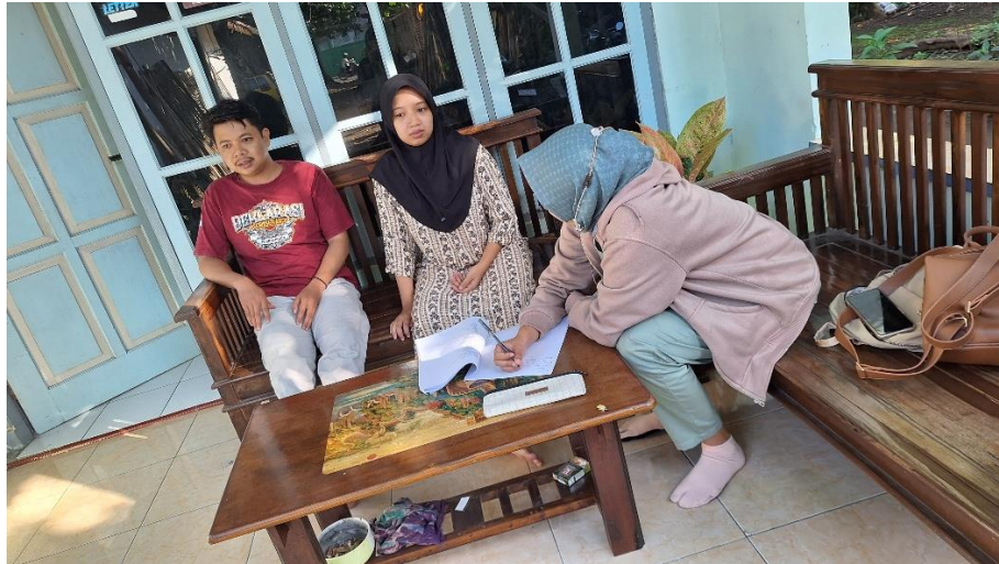
Kunjungan pada trimester II di rumah Ny. N