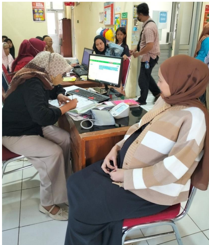
Pemeriksaan ANC trimester III di Puskesmas Kalikajar