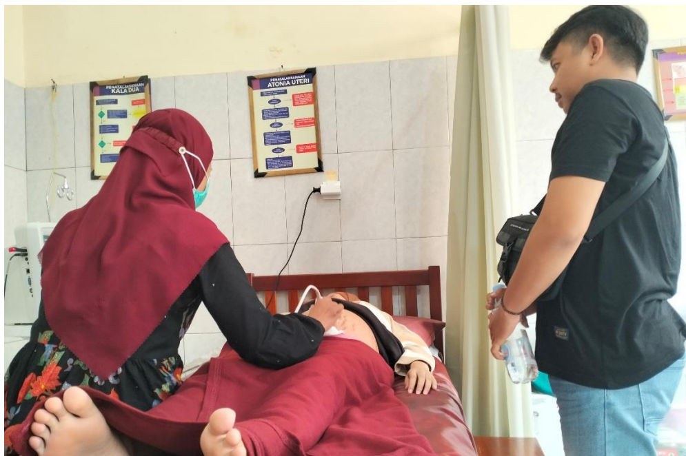
USG pada trimester III di Puskesmas Kalikajar