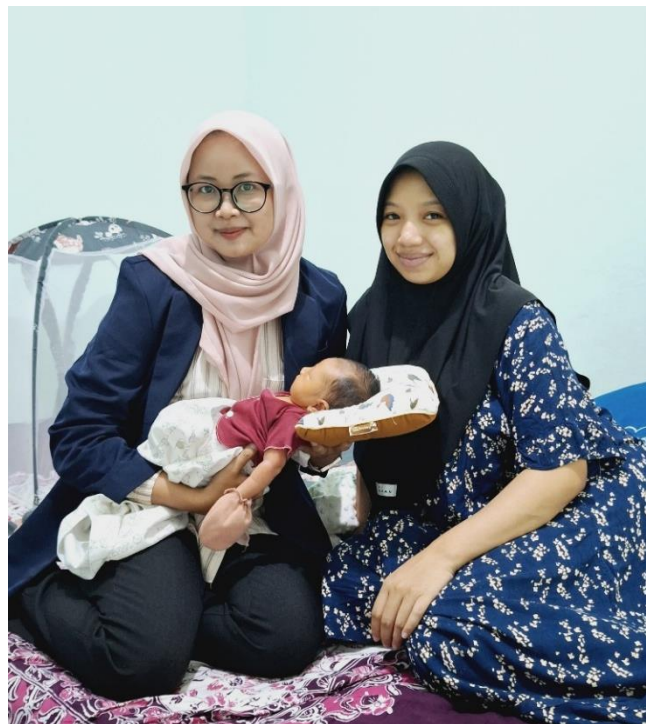
Kunjungan Neonatal hari ke 7