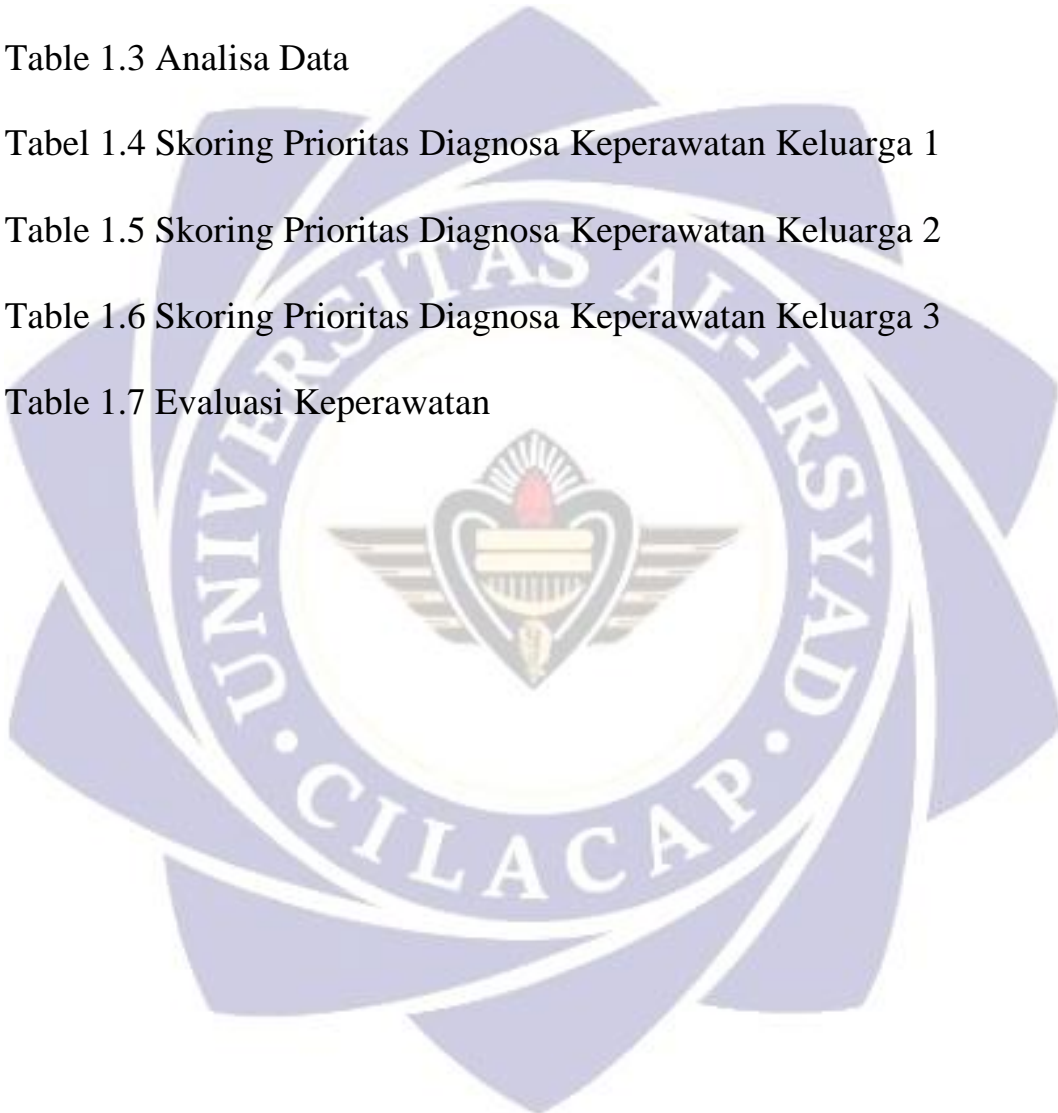
Table 1.7 Evaluasi Keperawatan

Table 1.6 Skoring Prioritas Diagnosa Keperawatan Keluarga 3