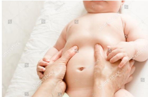
Gambar 2.1 Pemijatan Bagian Atas Pesar