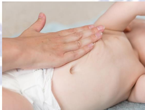
Gambar 2.2 Pemijatan di Tulang Panggul

Tulang panggul atau titik ST25 titik pijat ini terletak antara ditengah garis perut dan batas luar setinggi pusar, agar bisa menemukannya dengan mudah tarik garis tengah perut ke bagian bawah, kemudian pijit menggunakan dua jari atau usap dengan telapak tangan.