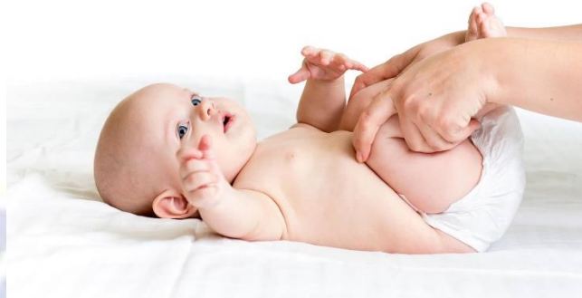
Gambar 2.3 Pemijatan di Tulang kering

memijat titik pijat untuk mengatasi diare dengan tepat gunakan empat jari dengan mengukurnya dari tempurung lutut.