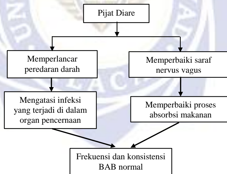
Bagan 2.2 Pathway Pijat Diare