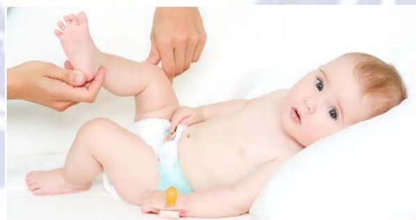
Gambar 2.4 Pemijatan di Bagian dalam Lutut

Pemijatan dilakukan dari bagian dalam lutut dan arah kebelakang lutut, akan terasa ada lekukan daging dibawah kepala tulang kering, tengah antara bagian depan dan belakang lutut, lakukan pijatan dengan sangat lembut.