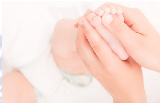
Gambar 2.5 Pemijatan di Bagian Atas Kaki

pertama dan kedua kaki,letakkan jari diantara jari kedua dan pertama, gerakan jari kebagian atas kaki,tapi tetap diantara kedua tulang, kira-kira sepertiga dari jarak pangkal kaki dan pergelangan kaki